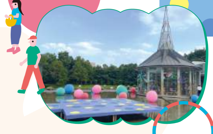
富士見市民文化会館