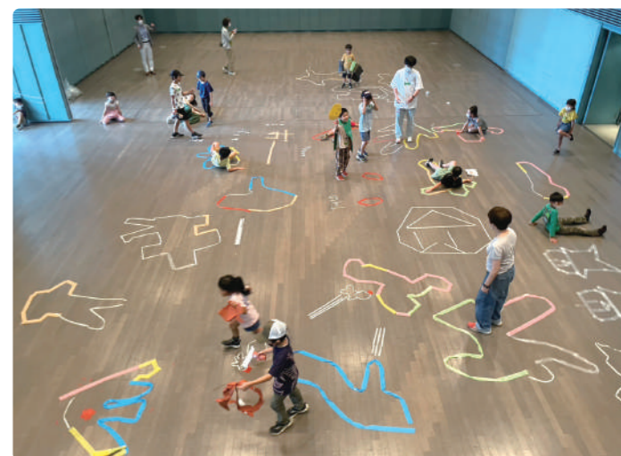
いろんなポーズをテープで型どり!

俳優、ワークショップファシリテーター。劇場や学校、社会福祉施設などでそこに集まった人たちと演劇をつくって遊ぶ活動をしている。元気が取り柄。世田谷パブリックシアター契約ファシリテーター。