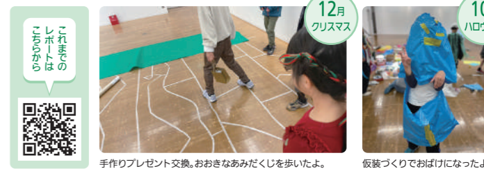
12月 クリスマス これからのレポートはこちら