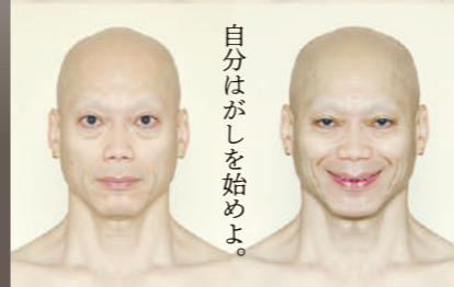
自分さがしを始めよ。

私じゃない あなたでもない 誰でもないし 誰でもいい 何も残さず 何も言わずに 宇宙の彼方に 飛んでゆけ