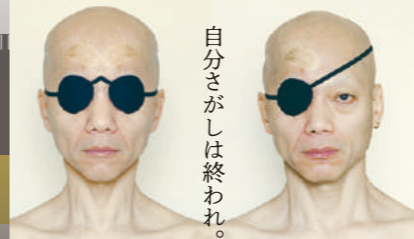
自分さがしは終われ。

この映画には映像がありません。音だけの映画です。音だけの世界で自分の中に映画を自由に作り上げていくような、そんな映画です。聴こえてくる音の中から人の生活や匂いを感じてください。隣にいる知らない人たちともなぜか親戚や昔から仲の良い友だちだったような気持ちになるかも? お祭りの夜が好きなら人にもオススメ。