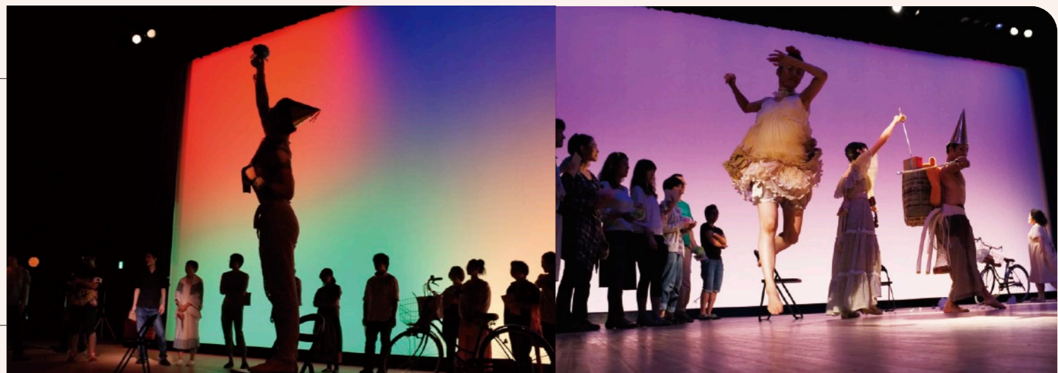
2011年『モガ!～記憶はだいたい憶測～』

富士見市民文化会館 キラリ☆ふじみ情報誌 2021 7月号 VOL.73 (7-10月)