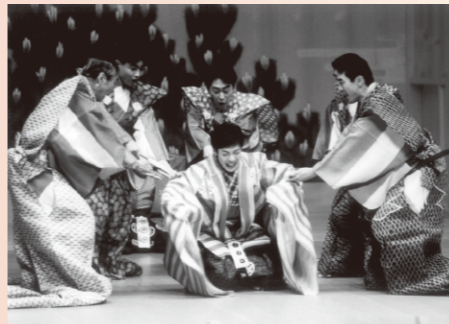
至芸の狂言師たちが織りなす、伝統芸能の神髄