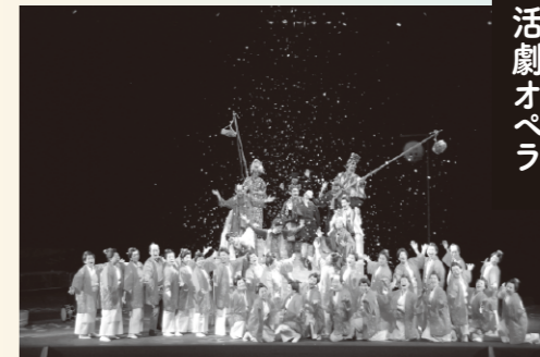
個性豊かなメンバーが綴る 活劇オペラ