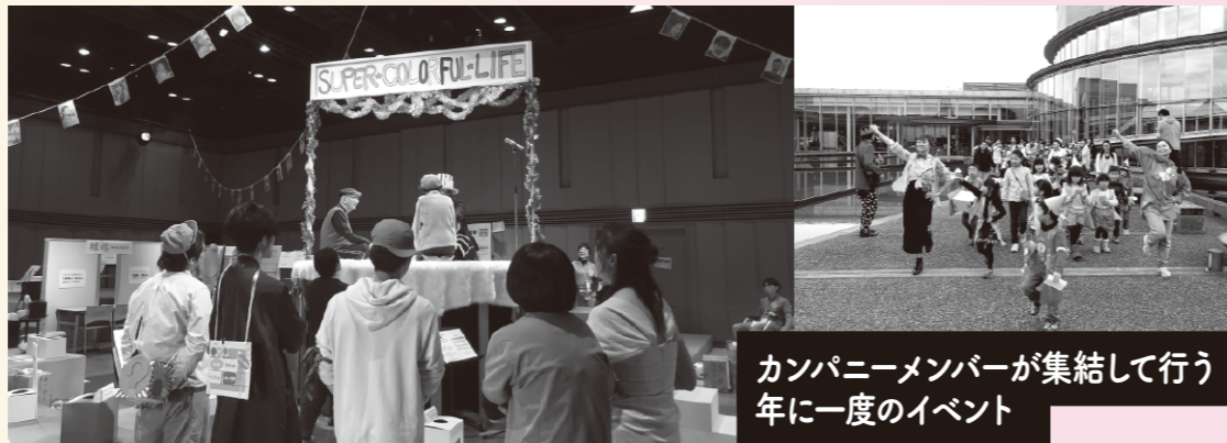
カンパニーメンバーが集結して行う年に一度のイベント