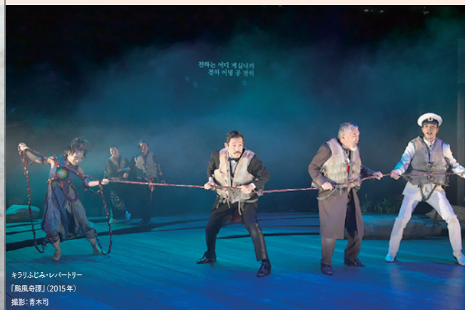
キラリふじみ・レパートリー 『鮫島奇譚』(2015年)

キラリふじみが昨シーズンからスタートさせた、東南アジアの舞台芸術とのコラボレーション・プロジェクト。第2弾は、芸術監督の多田淳之介が、日本・インドネシア・マレーシアのアーティストとともに創作する『BEAUTIFUL WATER』です。