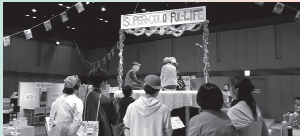
キラリふじみ・リージョナルカンパニー

ワークショップ 『なりきりサーカスワークショップ』(無料) 段ボールにカラフルな絵を書いて、お面や帽子、マントをつかって、大変身!みんなもかぼちゃサーカス団のメンバーになれる?! Ⓛ 7/7(土)・7/8(日) 12:30から終わりまで(予定)