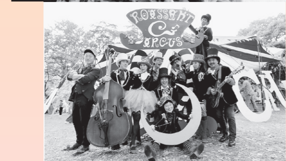
※その他、詳細は決定次第、チラシやホームページ等でお知らせします。