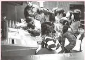
バックステージツアー