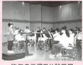
昨年の指揮者体験風景