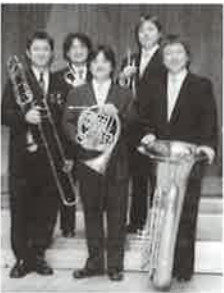
金管楽器メンバー

東京都交響楽団メンバーによる サンデー・トークコンサート 「金管・打楽器編」 聴くだけでなく一緒に参加し楽しめるコンサートです。ご家族そろって出かけください。 日時／2月1日(日)午後2時開演 料金／S席3000円 A席2000円 B席1000円 ※高校生以下S・A席は半額。 B席は一般と同額。 チケット発売中 チケット取り扱い／当館、CNプレイガイド