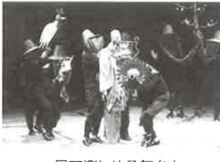
目で楽しめる舞台をお楽しみください。

日時／5月2日(日)午後2時開演 料金／一般1,000円 中学生以下500円 チケット発売日／3月7日(日) チケット取り扱い／当館