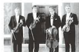
ウィーンフィルハーモニー 管弦楽団

チケット発売/10月3日(日) 取り扱い/当館、CNプレイガイド(03-5802-9990) ※未就学児の入場はご遠慮ください。