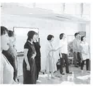
過去に他の施設で行なわれた こんにやく座のワークショップ風景

こんにやく座による 歌芝居のワークショップ 開館5周年の来年、いよいよ「オ ペラ(歌芝居)」に挑戦します!「演 劇大好き人間」も「音楽大好き人間」 も一緒に作り上げる「私たちのオ ペラシアター・キラリ☆ふじみ」に しよう!そんな「総合芸術」として のオペラ創りを目指します。日本 語を大事にし、日本語で歌うこと に真剣に取り組み中、あなたの 一番良い声を探していきます。合 唱などの経験がなくても歌や日 本語に興味のある方なら誰でも OKです。さあ、私たちと一緒に 新たな自分探しをしてみませんか! 指導/オペラシアター「こんにやく座」 日時/7月18日(火)夜、21日(金)夜、23日(日)午後 対象/15歳以上(中学生を除く)