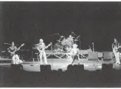
前回のキラリ☆バンドフェスティバル

メインホール キラリ☆バンド フェスティバル Vol.5 キラリ☆ふじみ夏の風物詩。 毎年好評を博している人気シリ ーズも五回目を迎えます。色々 な世代、ジャンルのバンドマン がメインホールにて熱いライブ を繰り広げます！乞うご期待！