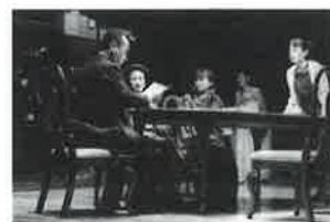
「ソウル市民1919」

※開場は各回20分前 会場／マルチホール チケット／一般3,000円 学生・シニア(65歳以上)2,000円 高校生以下1,000円(日時指定・全席自由・整理番号付) ※未就学児のご入場はご遠慮ください。