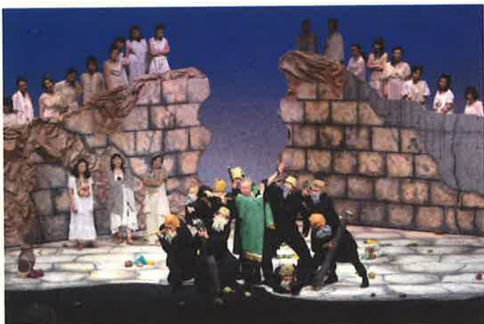
H20年度キラリ☆かげき団公演『女たちの平和』

2006年9月、キラリ☆ふじみ開館5周年を記念して市民公募により結成されたキラリ☆ふじみのアマチュア歌劇/かげき団。大学生から上は70代までの幅広い年齢層で、団員の大多数が、学校、仕事、家事との二足のわらじを履いて活動しています。そのうち男性が4名、女性が21名、女性がちよっぴり優勢な、総勢25名のパワフル集団です。日常の練習は、オペラシアターこんにやく座の指導を受けながら、年に1回のペースでキラリ☆ふじみでの公演をおこなっています。