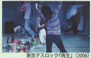
東京デスロック『再生』(2006)