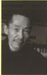
プロデュース/矢野誠

日本語で歌いはじめたとき、新しい音楽が生まれた… いま、「古い映画のように」あの幻の名盤が甦る 第一夜では、南佳孝の「摩天楼のヒロイン」を、第二夜では、あがた森魚の「噫無情」を、オリジナルメンバーとともに再現します。