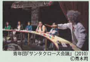
青年団『サンタクロース会議』(2010)