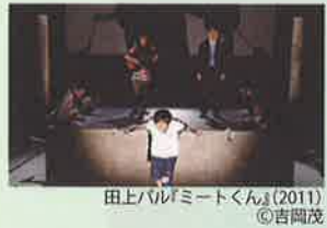
田上パル『ミートくん』(2011) ©吉岡茂