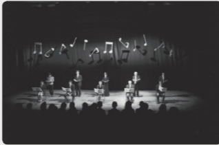
キラリふじみリーディング『かたりの椅子』

Ⓛ 2012年2/3金 午後7:00開演 Ⓜ メインホール Ⓢ 【全席指定】 一般4,500円 ペア8,000円 学生2,000円 Ⓢ 11/26土 Ⓜ 当館(オンライン予約あり) Ⓢ 500円, 締切1/27金, 定員5名 Ⓜ 終演後