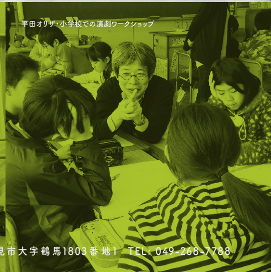
平田オリザ・小学校での演劇ワークショップ