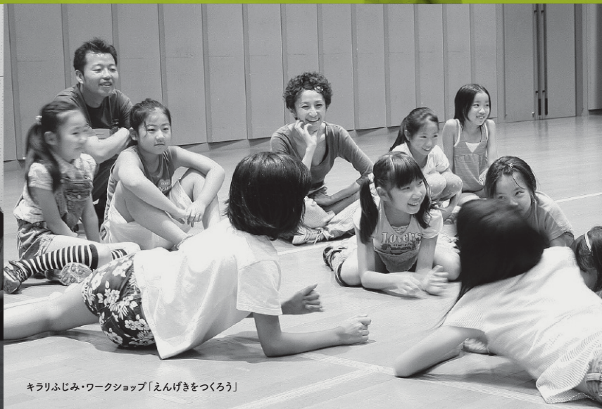
キラリふじみ・ワークショップ「えんげきをつくろう」