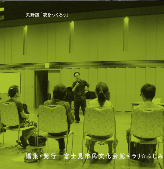
矢野誠「歌をつくろう」