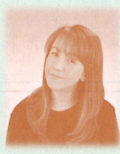
いろんな人 はまだきよ