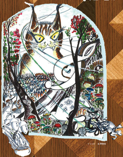
イラスト 長澤智林