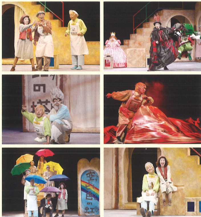
オペラ『口はロボットの口』受賞歴