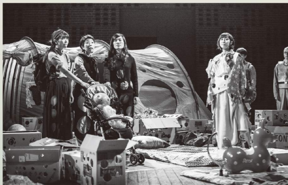
【亡国の三人姉妹】2016年10月 横浜赤レンガ倉庫1号館 3Fホール

生活の多様化、不安定な社会状況により旧来の幸せの価値観が崩壊した現代日本...社会的価値に頼らずに自分自身で幸せの価値を見つけることの困難さ、行き詰まりが、ある種の閉塞感を生んでいる。