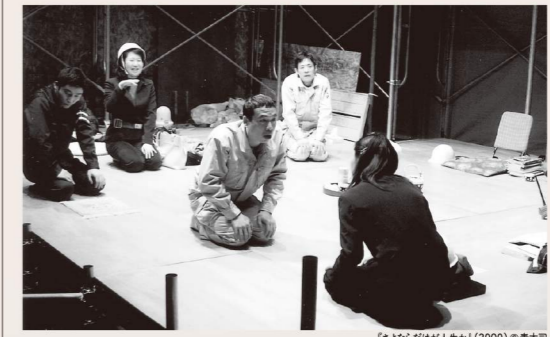
『さよならだけが人生か』(2000) ©青木功

雨が続く東京一。都内某所の建設現場に、折悪しく遺跡が発見される。遅々として進まない工事の現場で働く人々、発掘の手伝いに駆り出された学生たち、ゼネコン社員や文化庁から派遣された調査員など、様々な人間たちが訪れる現場では、いつ果てるともないユーモラスな会話が繰り広げられる。1992年に初演され、若き日の劇団「青年団」が一躍名を馳せた伝説的作品。2000年のリニューアル上演以来、17年ぶり待望の再演です。