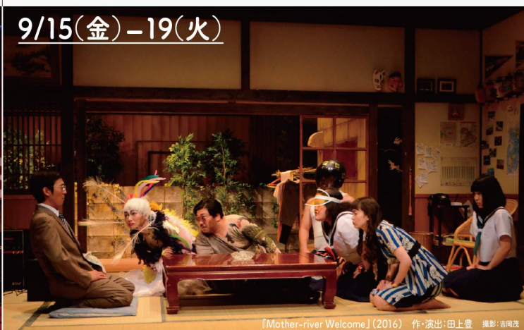
『Mother-river Welcome』(2016) 作・演出:田上豊

1971年秋。大学1年生の原田満男は、親からの「自立」を宣言し、東京は高円寺のアパート春風荘で下宿生活を始める。このアパートに住んでいるのは、反戦運動家、新劇女優、チンピラのクリーニング屋、ヒッピーなど、風変わりな面々。満男は、移ろいゆく時代と彼らに振り回される日々のなか、さらに思いもよらない事件に巻き込まれていく――。